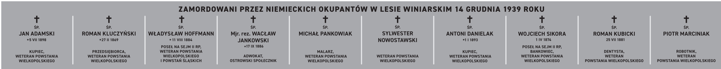
I rząd z prawej (1939); wielkość płyty: 630 x 60 cm