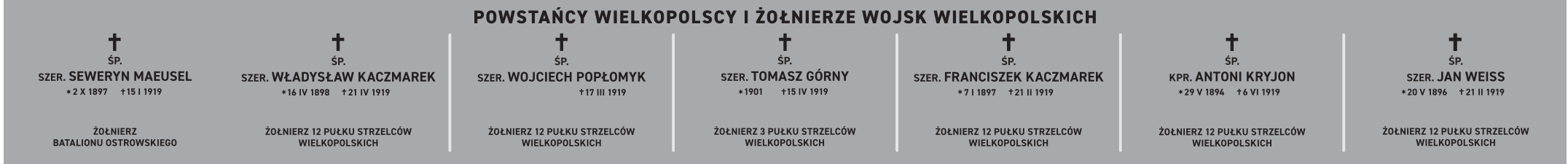
II rząd z prawej – Powstańcy Wlkp; wielkość płyty: 567 x 60 cm