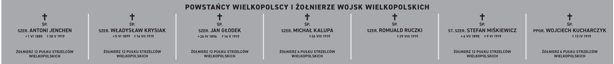
II rząd z lewej – Powstańcy Wlkp; wielkość płyty: 567 x 60 cm