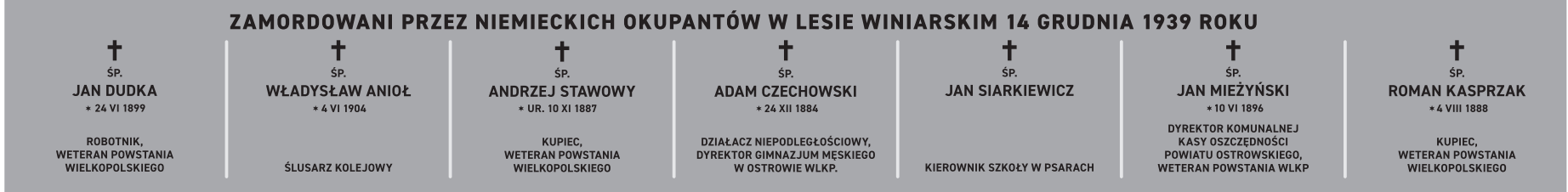
I rząd za pomnikiem; wielkość płyty: 486 x 60 cm