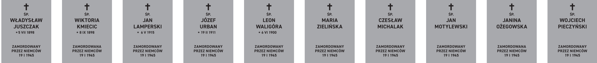
Ofiary zbrodni w lesie Skarszewskim 19 stycznia 1945 r.; wielkość płyt z napisami – 46 x 60 cm