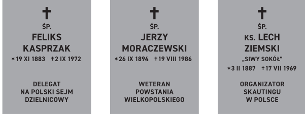
Pochówki powojenne; wielkość płyt z napisami – 46 x 60 cm