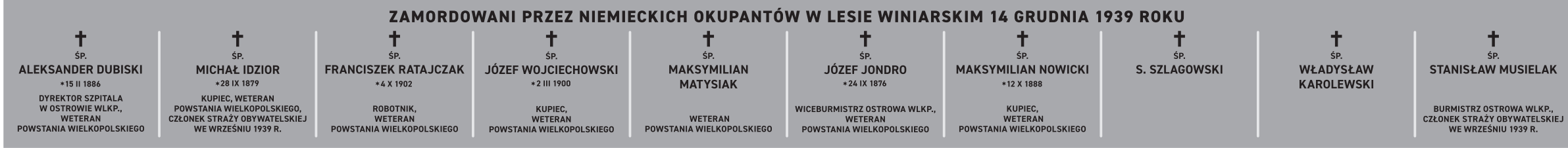
I rząd z lewej (1939); wielkość płyty: 630 x 60 cm